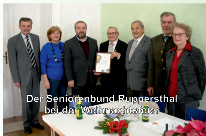
Der Seniorenbund Rupperthal bei der Weihnachtsfeier