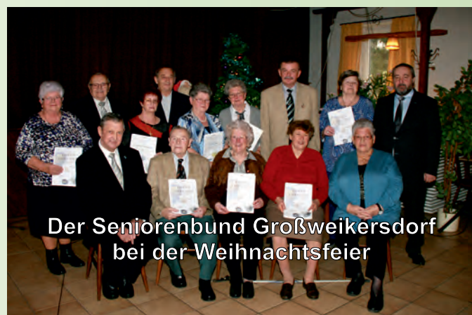
Der Seniorenbund Großweikersdorf bei der Weihnachtsfeier