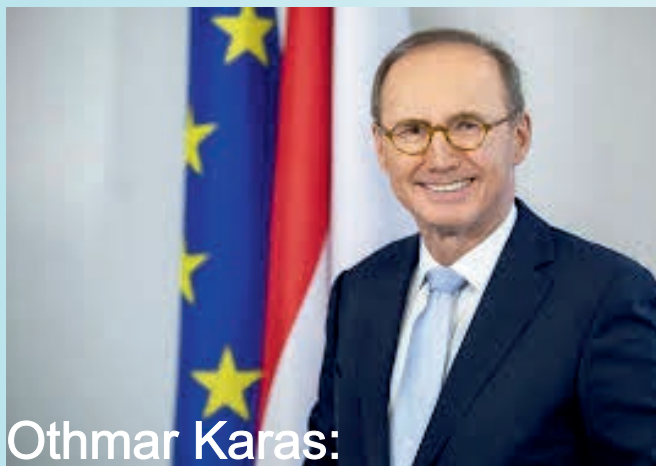
Othmar Karas: Europa beginnt in Österreich

Mit Deiner Unterstützung möchte ich auch in Zukunft ein starkes Europa im Interesse Österreichs mitgestalten. Denn Europa muss man verstehen, um es verändern zu können.